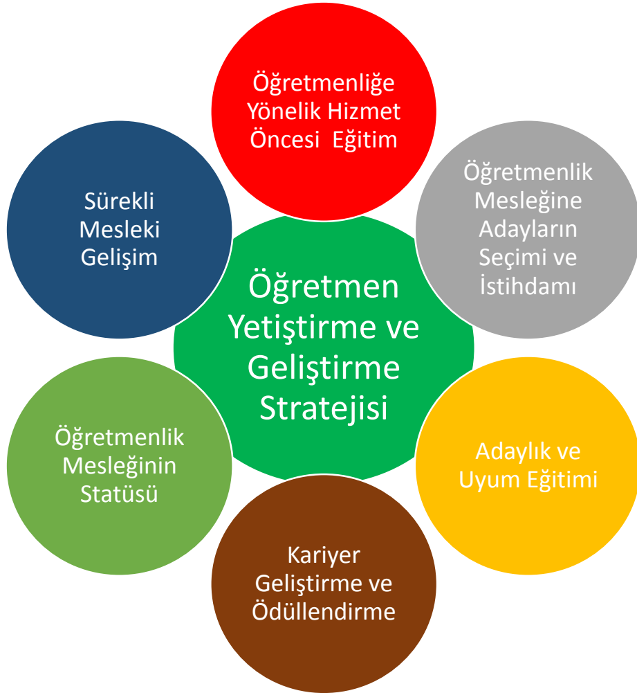
Şekil 1. Öğretmen Strateji Belgesi Ana Temalar

Öğretmen strateji belgesinde öğretmenlik mesleğine yönelik politikaların geliştirilmesi için, gerek öğretmenlik mesleğine ilişkin süreçler gerekse temel sorun alanları göz önünde bulundurularak 6 ana tema belirlenmiştir. Belgede yer alan amaç, hedef ve eylemler Şekil 1'de yer alan ana temalar dikkate alınarak oluşturulmuştur.